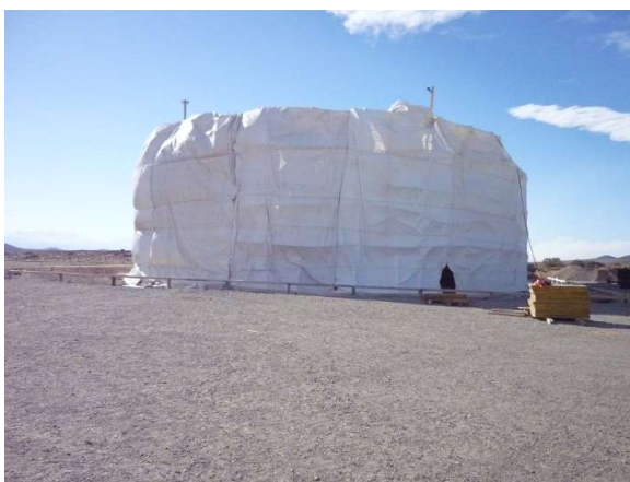
Fotografías de antena Aeroespacial con protección de carpas y calor perimetral