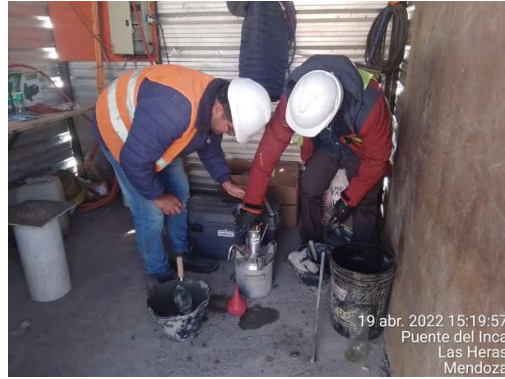
Fotografías de toma de temperatura y contenido de aire del hormigón fresco