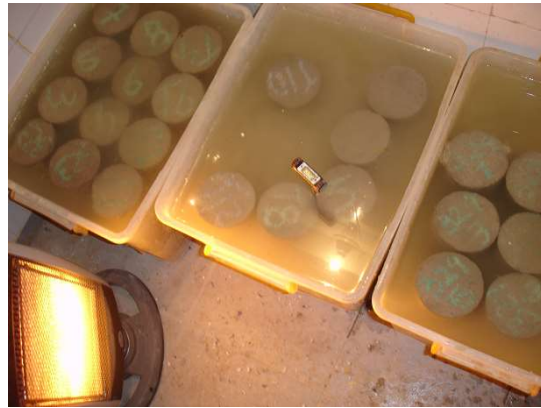
Protección específica de probetas de las bajas temperaturas (primeras 24 hs y luego curado)