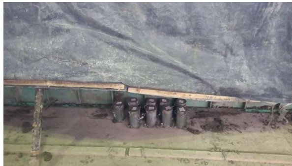
Moldeo de probetas y curado a un costado de la estructura (mismas condiciones)