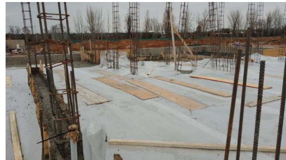
Fotografías de colado en condiciones de tiempo frío de viviendas – Protección de vigas de fundación y losas