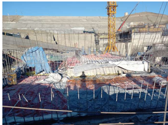
Fotografías de grandes presas – Protección de encofrados con poliuretano y mantas térmicas en losas EJEMPLOS DE PROTECCIÓN ACTIVA (Con “carpas”, microclimas y aporte de calor)