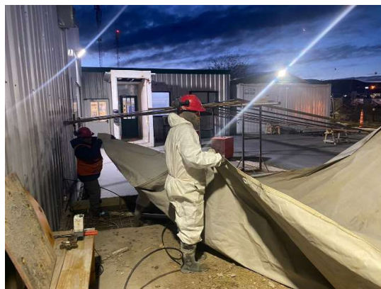
Fotografías de obras en la Patagonia generando "carpas" y luego dando temperaturas propicias