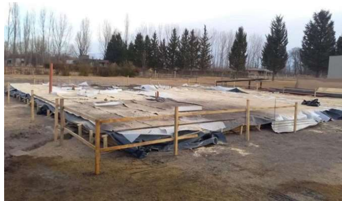
Fotografías de colado < 0 °C en pavimentos de alto tránsito y plateas – Protección con pluribol e aislant