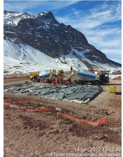
Fotografías de colado en alta montaña – Protección con triple pliegue de polietileno de burbujas