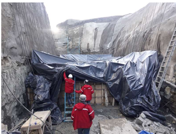
Fotografías de obras en la Patagonia aportando calor con generadores