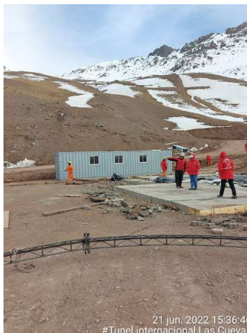
Ensayos no destructivos para medir el grado de endurecimiento de hormigones en tiempo frío